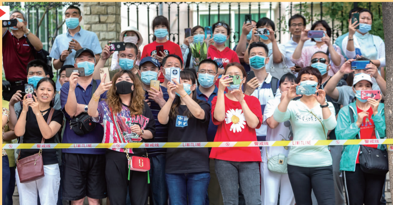
考场外等待的家长拿起手机记录下孩子们人生中重要的一次考试