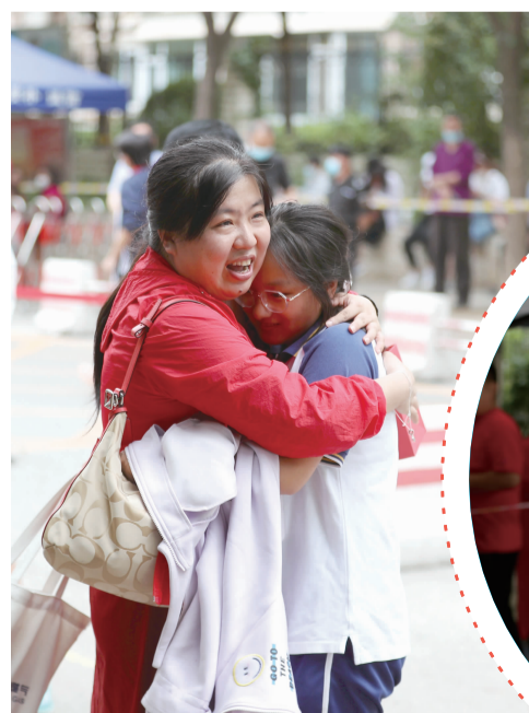
考生忍不住与家长相拥

花无复开日,人无再少年。时间过得真快,刚和烂漫的春花走过一段旅程,火热的夏天已和每一个人结缘相伴。花影还在,季节已换。每一位高三的学子,都将在这个六月接受挑战。战胜高考,战胜自我。