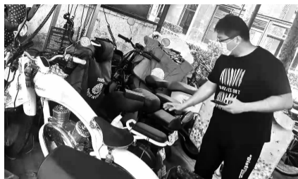
工作人员对车棚内车辆停放进行整改