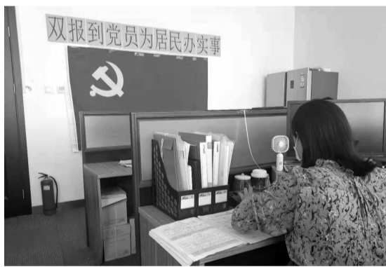
在职党员电话询问居民疫苗接种情况

“每周都有10余位在职党员会参加我们的活动，近期我们的重点工作在疫苗接种及返京人员排查上，所以就让党员协助我们开展这项工作。”社区工作人员说