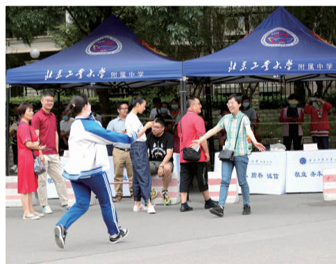
走出考场的孩子迫不及待拥抱母亲