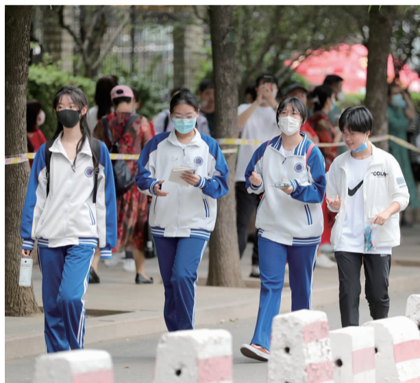
出考场的孩子们

最后,祝各位考生旗开得胜,金榜题名。相信在这场重要的考试里,大家都将乘风破浪,获得扬帆起航的船票!