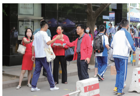
孩子们有坚强的后盾