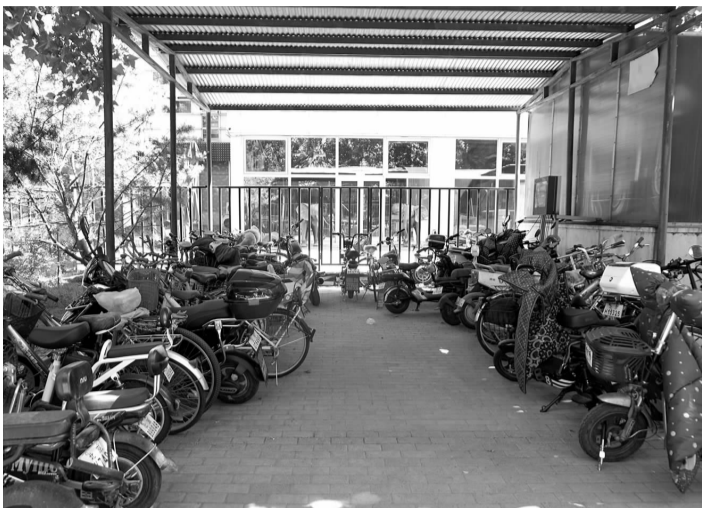
小区内车棚停满各类车辆