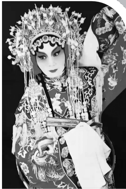
解久和《贵妃醉酒》扮相照