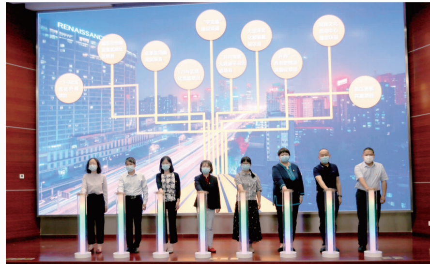
各部室代表上台共同点亮心愿灯柱对品牌项目进行了认领。

2021年是中国共产党成立100周年，也是“十四五”开局起步之年。“十四五”时期是我国全面建成小康社会，实现第一个百年奋斗目标之后，乘势而上开启全面建设社会主义现代化国家新征程，向第二个百年奋斗目标进军的第一个五年，谋篇布局“十四五”规划，关系到双井街道未来长远发展。6月5日，双井街道召开“十四五”规划发布会，向社会报告双井地区“十四五”发展规划。