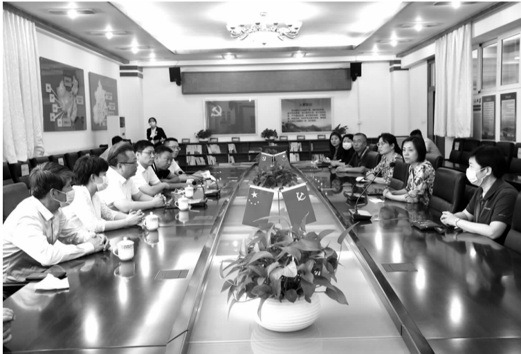
双井街道领导走进辖区高考考点北京工业大学附属中学(富力城校区)