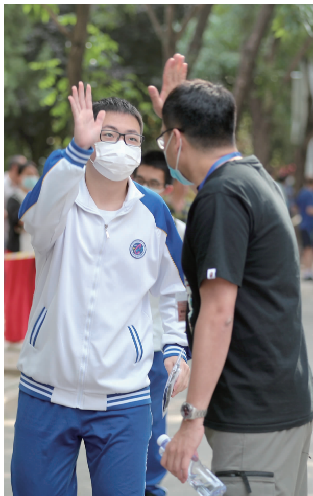
家长与孩子击掌,互相鼓励。