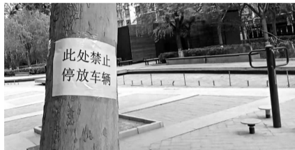
物业粘贴禁停标识