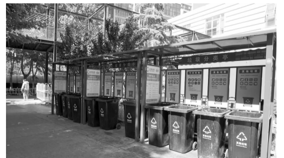
整改后保留三组垃圾桶站

“我们到现场后看到,在距离地下车库出口位置大概15米左右的距离设置了6组垃圾桶站。”工作人员说道。在垃圾分类实施开始后,后现代城物业积极开展相关工作,并开展撤桶并站工作。由于B区属于开放式小区,并且有超市及众多餐饮店铺,当时物业考虑到餐饮行业每天垃圾投放量比较大,就集中在靠近地下车库出口位置设置了6组垃圾桶站,每组垃圾桶站有4个垃圾桶,这样便于